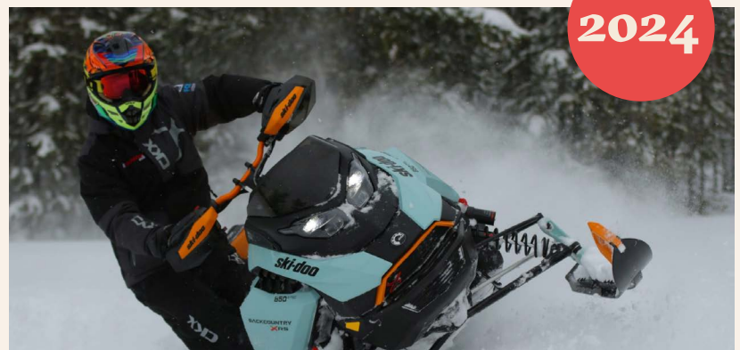
Ski-Doo – motoneiges.ca