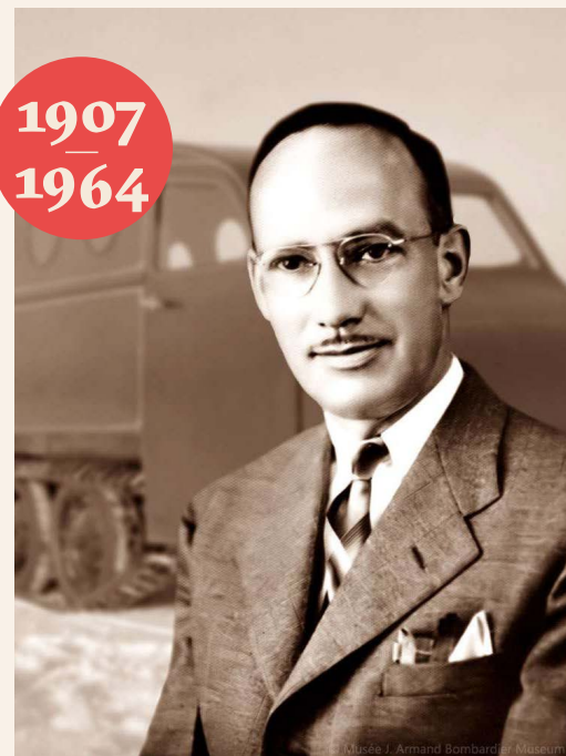
Joseph-Armand Bombardier