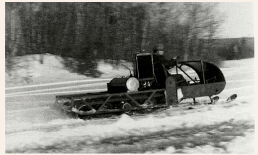
Sur la rivière au Saumon de Kingsbury, l'inventeur teste le premier ancêtre du Ski-Doo

Extraits : Joseph-Armand Bombardier : le rêve d'un inventeur , Roger Lacasse, Libre Expression, 1988