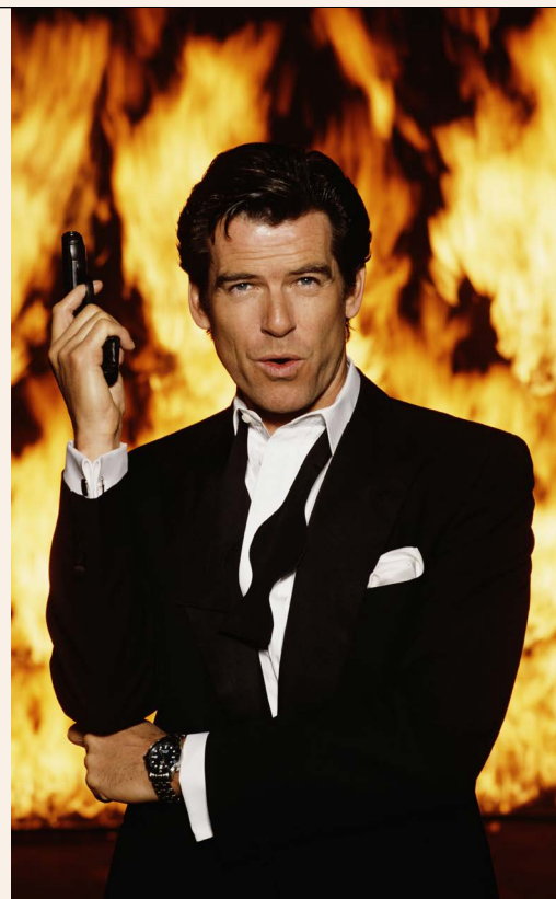
Pierce Brosnan en "smoking" dans Golden Eye . L'uniforme "bondésien" par excellence.