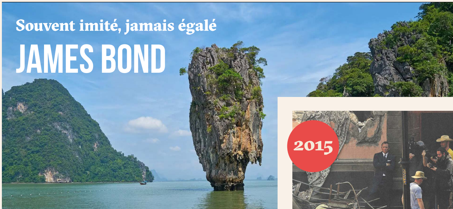
L'homme au pistolet d'or avec Roger Moore, 1974, Baie de Phang Nga près de Phuket en Thaïlande

« Un tour du monde au fil des aventures de James Bond, l'espion britannique, pour découvrir les lieux de tournage, des anecdotes et des analyses de films. Depuis 1962 et sa première mission en Jamaïque ( James Bond 007 contre Dr No ) sur grand écran, l'agent secret le plus célèbre du monde sillonne inlassablement le globe... que des méchants mégalomanes projettent régulièrement d'anéantir. Au fil des vingt-cinq épisodes de la plus belle et plus ancienne franchise du cinéma, Bond est devenu ce VRP de luxe, jamais pris au dépourvu, qui semble chez lui partout dans les plus beaux endroits de la Terre, quelles que soient les latitudes et les températures. Au gré des pages de cet atlas cinématographique, parcourez avec nous la planète, en toute tranquillité et toute sécurité, sans craindre les désagréables effets du jetlag. »