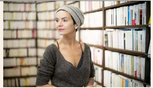
Anaïs Barbeau-Lavalette comédienne, réalisatrice et autrice québécoise