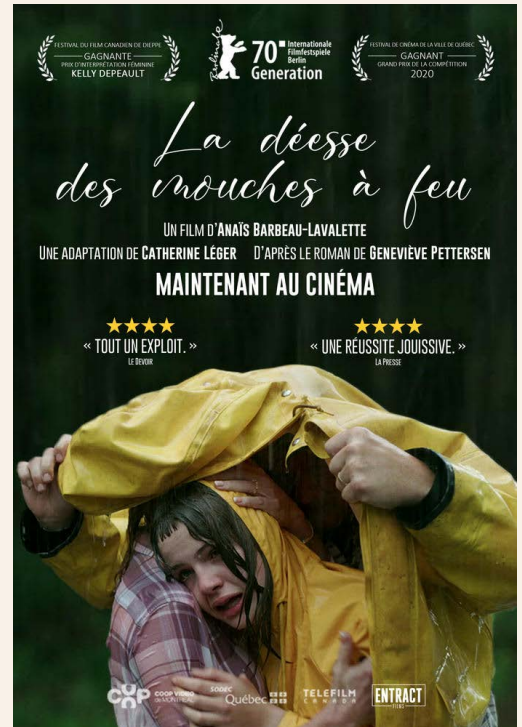
La déesse des mouches à feu, film, 2020