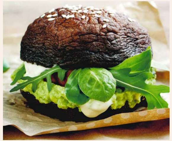
Burger de chapeaux de portobellos - source photos et extraits : Le meilleur des champignons du Québec, Pascale Coutu et Pierre Tremblay, Éditions Goélette, 2019

Le meilleur des champignons du Québec, Pascale Coutu et Pierre Tremblay, Éditions Goélette, 2019 COTE : 641.658 C872M