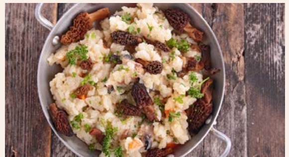
Risotto aux morilles

Réponse : 1) Ils sont en abondance un peu partout au Québec de la fin-août à la fin-octobre. 2) Des cercles de champignons qui se forment sur l'herbe.